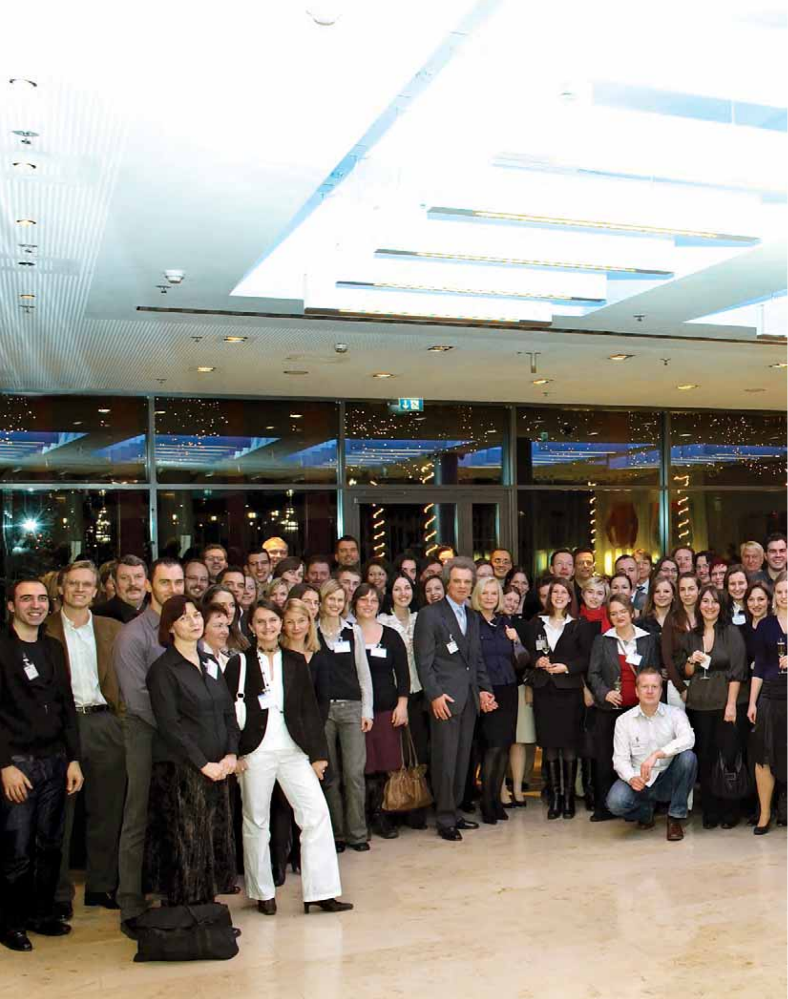
Schulungswochenende des Projektmanagement-Teams der KERN AG 13.-14. Dezember 2008